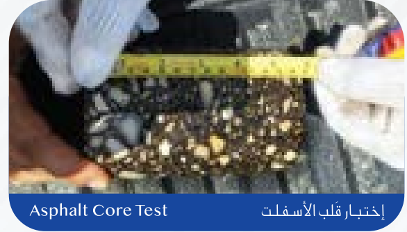
Asphalt Core Test

يقوم فريق من المهندسين والعاملين والمختصين بمتابعة وإدارة الأعمال فنياً وإدارياً بشكل مباشر ودائم، بحيث تضمن تسليم كافة الأعمال حسب المواصفات والمقاييس المطلوبة وذلك بأعلى جودة. تضمن الشركة للعملاء الكرام الأعمال وذلك بتقديم خطاب من قبلنا بضمان الأعمال المنفذة مصدقاً من الغرفة التجارية وذلك حسب شروط وبنود الإتفاق.